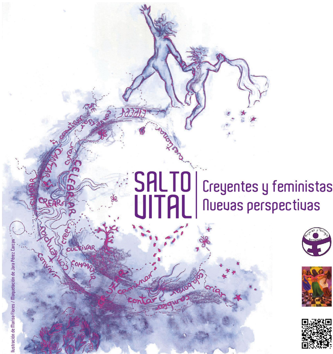
Ilustración de Marisa Flores / Maquetación de Jara Pérez Larcas

28, 29 y 30 de septiembre de 2018 / Centro Pignatelli, Pº Constitución 6, Zaragoza.