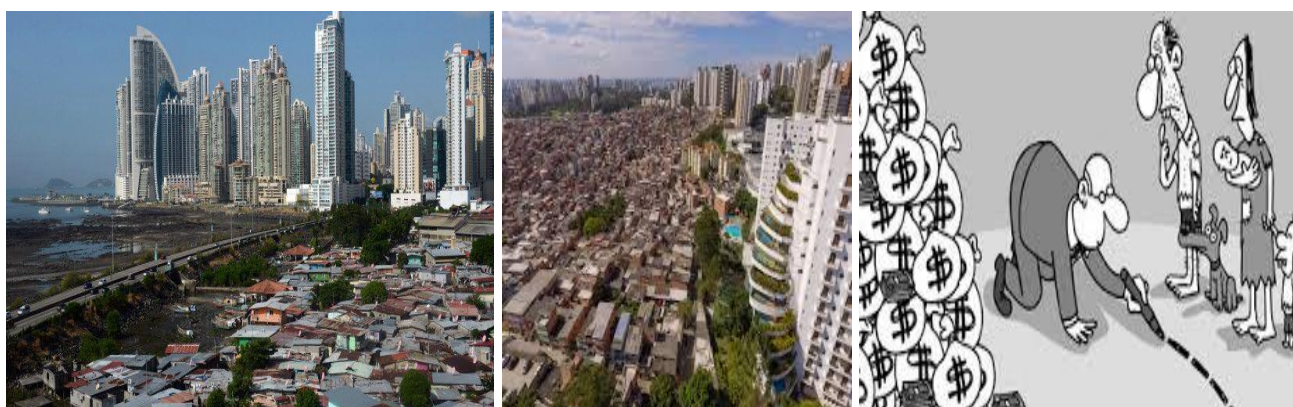
Imágenes que hablan por si solas

- El IDH (Indice de Desarrollo Humano) de Itiúba es tan solo del 0,544, uno de los Municipios más pobres del Estado de Bahía, y de Brasil en general, que tiene un IDH de 0,765. El problema se agrava porque hay una gran desigualdad social en el país, y en particular en Itiuba, pues en este Departamento el IDG (Indice de Gini) es de 0,533, que, según la ONU, un coeficiente de Gini superior a 0,400 es alarmante, ya que esto indica una insostenible realidad de desigualdad y de polarización entre ricos y pobres, siendo caldo de cultivo para el antagonismo entre las distintas clases sociales pudiendo llevar a un descontento y agitación social importante, incluso con riesgo de vidas humanas.